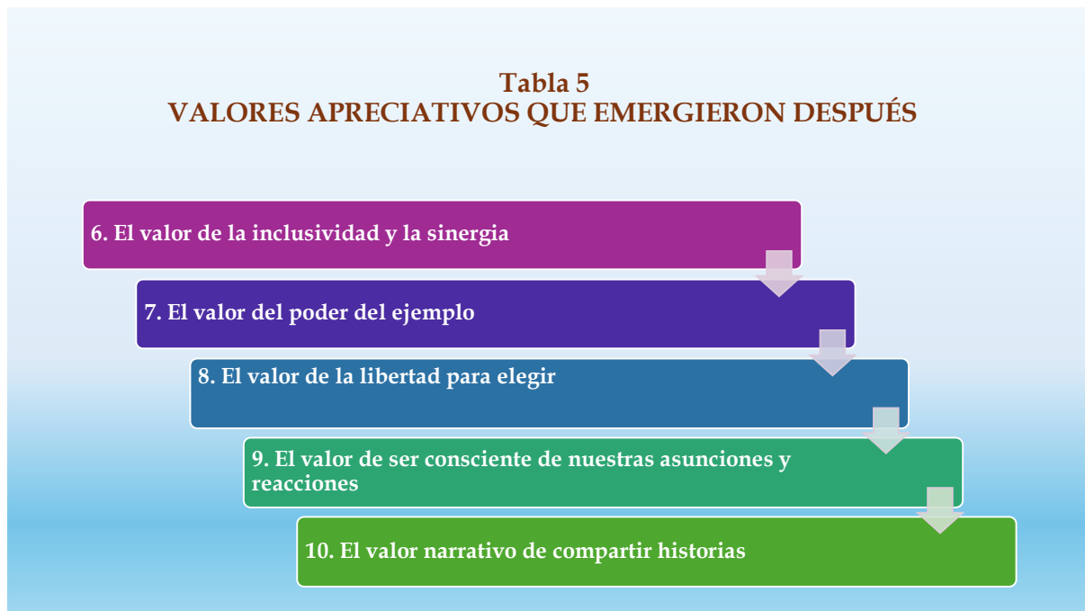
Tabla 5 VALORES APRECIATIVOS QUE EMERGIERON DESPUÉS