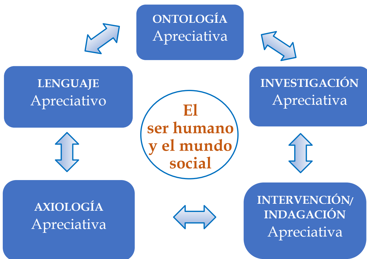
Gráfico 1 COMPONENTES DEL PARADIGMA APRECIATIVO

Para entender lo que es La Intervención-Indagación Apreciativa , en toda su profundidad y de una manera orgánica, necesitamos verla como uno de los componentes del Paradigma Apreciativo. El Paradigma Apreciativo es “una nueva manera de ver y entender (Ontología), estudiar (Epistemología/Investigación), transformar (Intervención-Indagación/Praxis), valorar (Axiología), y hablar (Lenguaje) del ser humano y su comportamiento en el mundo social y natural en el que vive. Este paradigma ha sido adoptado por una comunidad de académicos y practicantes a nivel global porque lo encuentran más efectivo que otros paradigmas de cambio personal y social como lo demuestra el desarrollo y éxito alcanzado, a nivel práctico y teórico, en los 39 primeros años de su existencia” (Varona, 2023, p. 14). Las características fundamentales de cada uno de estos componentes del Paradigma Apreciativo se encuentran desarrollados en el ensayo: El Paradigma Apreciativo: de la Metodología al Paradigma (Varona, 2024d). The Appreciative Paradigm. From Methodology to Paradigm (Varona, 2023).