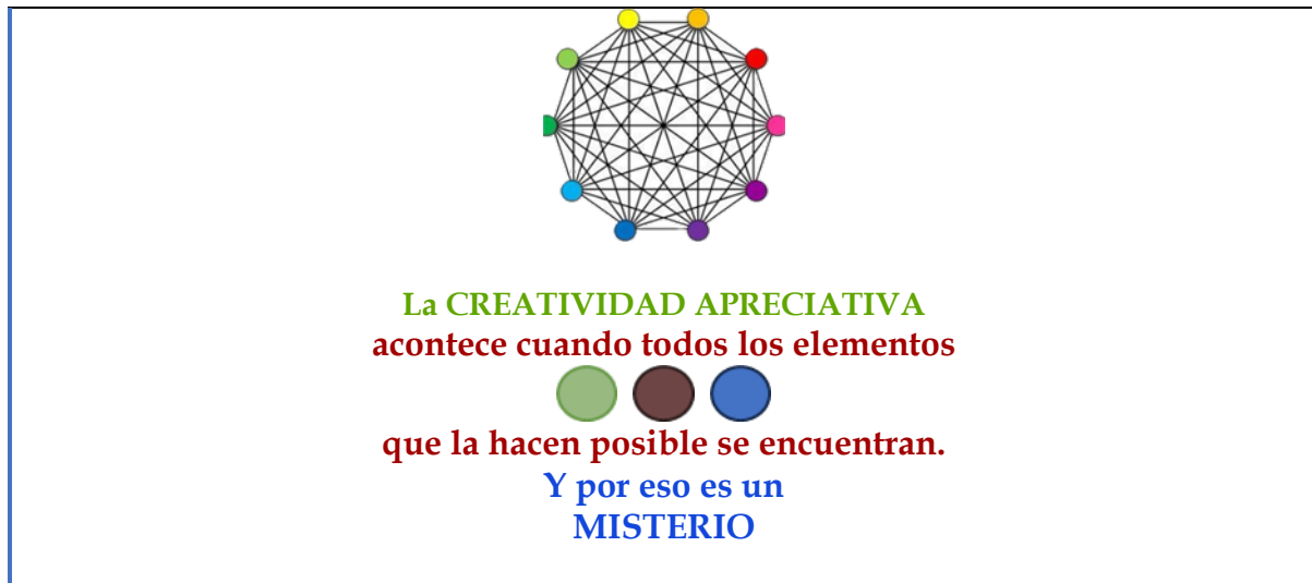
Gráfico 3 TEORÍA DEL ENCUENTRO DE LA CREATIVIDAD

Y termino esta sección con unas reflexiones sobre el tema de cómo diferenciamos una buena teoría de otra que no lo es. ¿Existen criterios universalmente aceptados por científicos y académicos? La respuesta es no, pero si existen ciertos criterios que son asumidos como condiciones necesarias para poder evaluar la validez y el poder de una teoría. Entre estas condiciones está el que el proceso de creación de la teoría haya sido riguroso en todas sus fases, tal como lo he presentado en secciones anteriores. Otra condición sería que la teoría se relacione con la información empírica recogida. Pero, también hay otras condiciones que retan a las que tradicionalmente se han asumido como las únicas y mejores, como las que propone Cooperrider cuando dice que estas serían las preguntas que también tenemos que hacernos a la hora de evaluar una teoría: “¿Hasta qué punto esta teoría presenta nuevas posibilidades provocativas para la acción social y hasta qué punto estimula la normativa del diálogo sobre cómo podemos y debemos organizarnos?” (Cooperrider, 2021, p. 66).