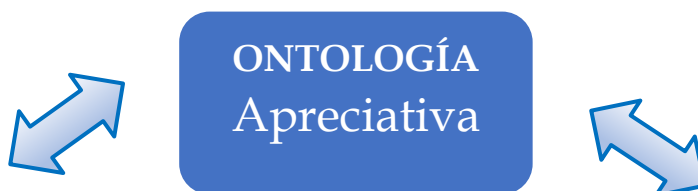
Gráfico 1 COMPONENTES DEL PARADIGMA APRECIATIVO

La Investigación Apreciativa es una nueva forma de entender la investigación en el campo de las ciencias sociales y cuyas bases teóricas y empíricas emergen del Paradigma Apreciativo . Por lo tanto, la Investigación Apreciativa adopta la Ontología Apreciativa, la Intervencions/Indagación Apreciativa, la Axiología Apreciativa y el Lenguaje Apreciativo. Veamos más en concreto como cada uno de esos componentes inspira y guía la práctica de la Investigación Apreciativa.