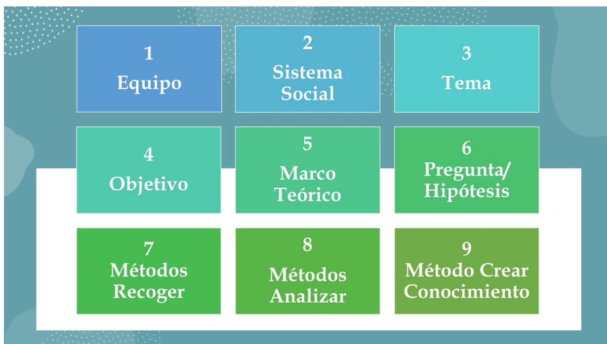
Gráfico 6 FASES DE LA PLANIFICACIÓN DE LA INVESTIGACIÓN APRECIATIVA

La lista y el orden de estas actividades, que propongo como una hoja de ruta básica y orgánica, son por supuesto susceptibles de todo tipo de cambio y adaptación.