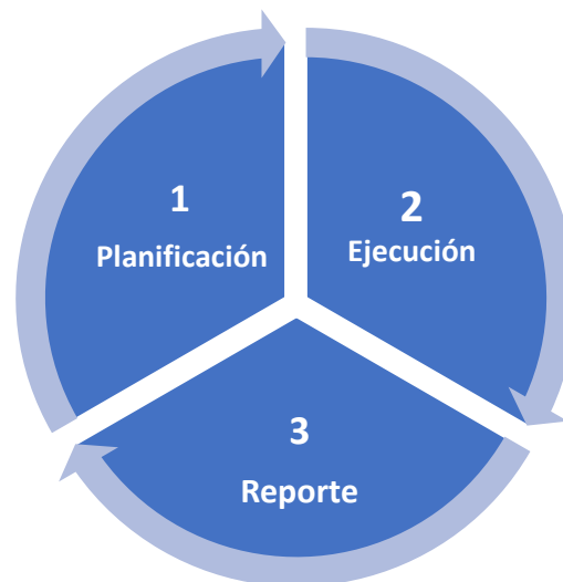
Gráfico 5 FASES DE LA REALIZACIÓN DE LA INVESTIGACIÓN APRECIATIVA

propuesta de investigación, la segunda la fase de ejecución, y la tercera la fase de creación del reporte final y/o del documento para ser presentado y publicado.