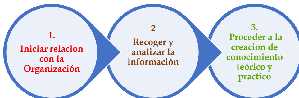
Gráfico 7 FASE DE LA EJECUCIÓN DE LA INVESTIGACIÓN